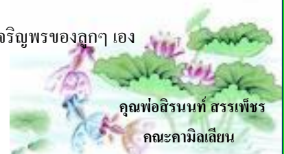
คุณพ่อสิรินนที สรรเพ็ชร คณะคามิลเลียน