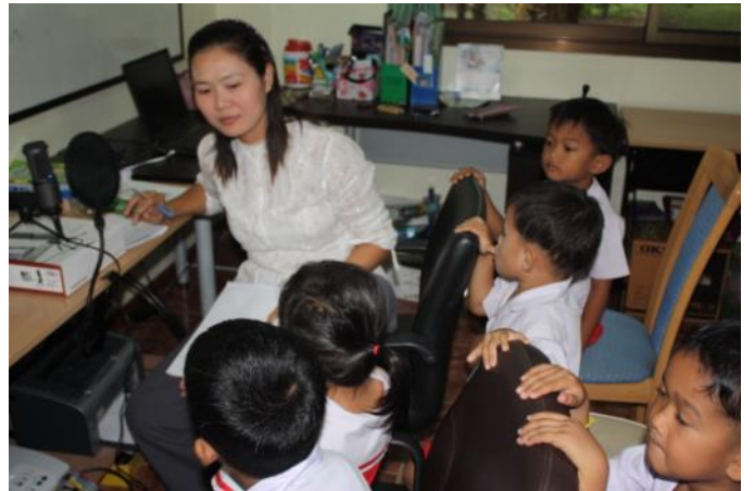
ดั่งที่พระเยซูเจ้าได้ทรงสั่งบรรดาศิษย์ของพระองค์

“ สิ่งที่เราบอกท่านในที่มืด ท่านจงกล่าวออกมา ในที่สว่าง สิ่งที่ท่านได้ยินกระซิบที่หู จงประกาศบน ดาดฟ้าหลังคาเรือน ” ( มธ 10:27 ) พระเจ้าทรงรักมนุษย์อย่างไม่มีการสิ้นสุดและทรงเผยแสดง ความรักนี้โดยผ่านทางพระเยซูเจ้า ผู้ทรงเป็นศูนย์กลางที่ พระองค์ทรงใช้ติดต่อสื่อสารกับมนุษย์ ด้วยเหตุนี้ มนุษย์ ต้องใช้เทคโนโลยีและการสื่อสารทุกชนิดเพื่อเป็นเครื่องมือ เผยแพร่ความรักและข่าวดีของพระเจ้าไปทั่วทุกมุมโลก ทั้ง “ในที่สว่าง” และ “ บนดาดฟ้าหลังคาเรือน ” เหมือน